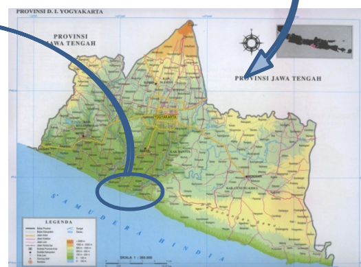
Gambar 32. Provinsi Daerah Istimewa Yogyakarta

Lokasi Penelitian: Pantai Depok, Kabupaten Bantul, DIY.