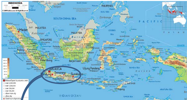
Gambar 30. Peta Indonesia