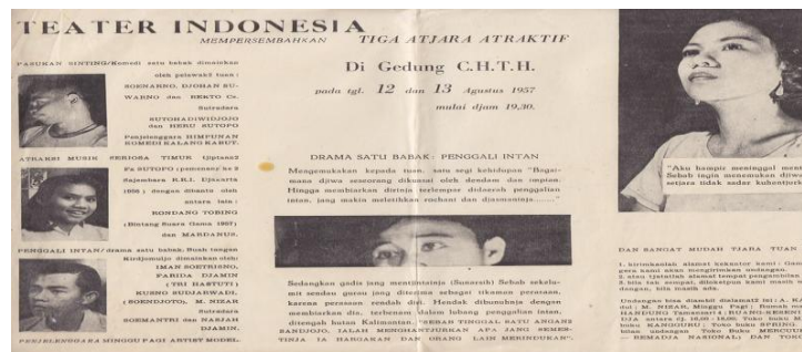
Publikasi pementasan Teater Indonesia dengan lakon Penggali Intan pada tahun 1957 di gedung CHTH, Yogyakarta