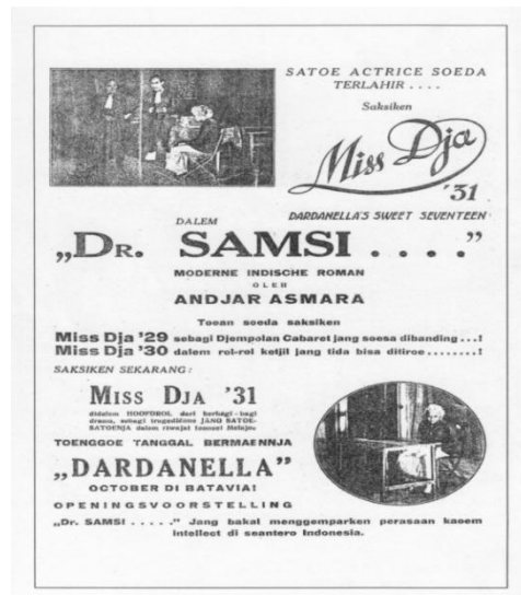
Poster pementasan kelompok Dardanella dengan lakon Dr. Samsi pada tahun 1931