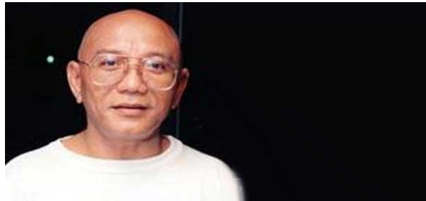
Arifin C Noer, salah satu anggota dan sutradara Teater Muslim. Beliau juga dikenal sebagai sutradara film dan pimpinan Teater Ketjil