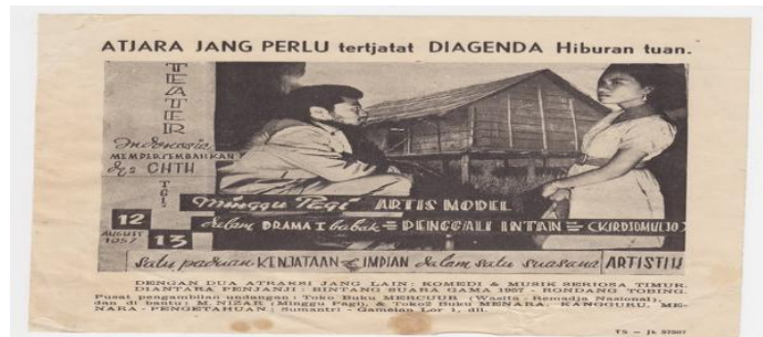
Publikasi pementasan Teater Indonesia dengan lakon Penggali Intan pada tahun 1957 di gedung CHTH, Yogyakarta