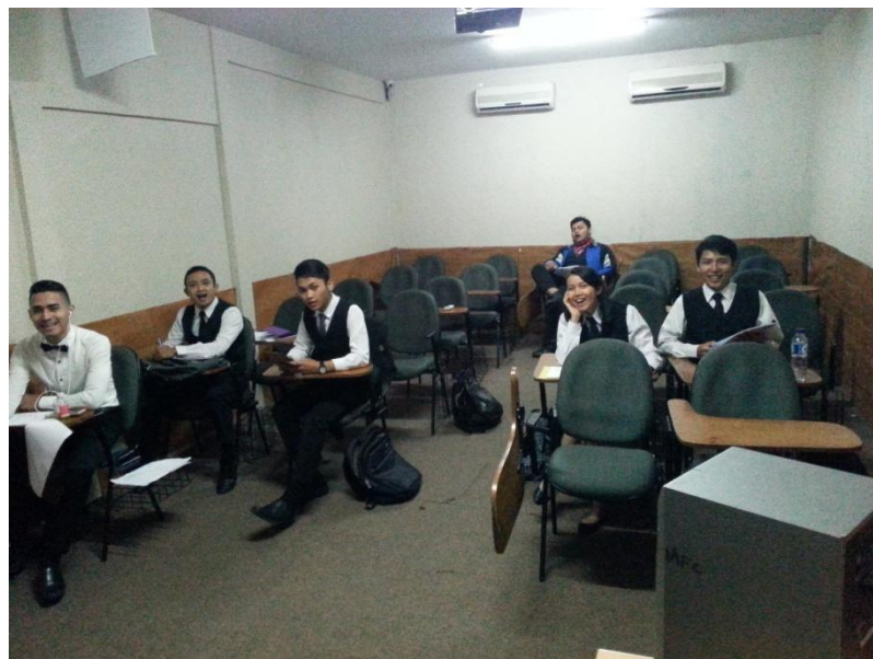
Gambar 2 : Siswa mengikuti pelatihan dengan semangat