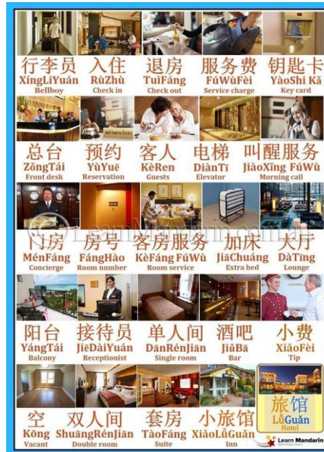
Gambar 6 : Kosakata bahasa Mandarin untuk perhotelan (sumber : http://www.hanbridgemandarin.com )

Lampiran 7. Gambar kosakata yang berhubungan dengan perhotelan dan dapur restoran di kapal pesiar