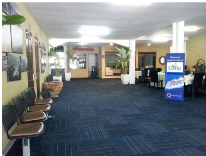
Gambar 5: Lobby Sekolah perhotelan Kapal Pesiar Miami Fleet Yogyakarta