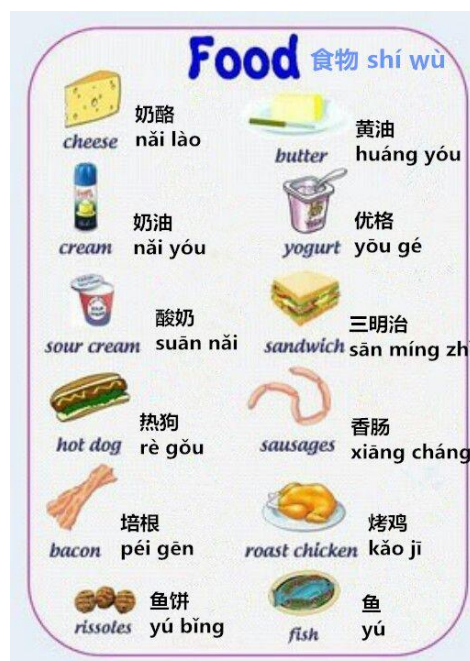
Gambar 14 : Bahan pelengkap makanan