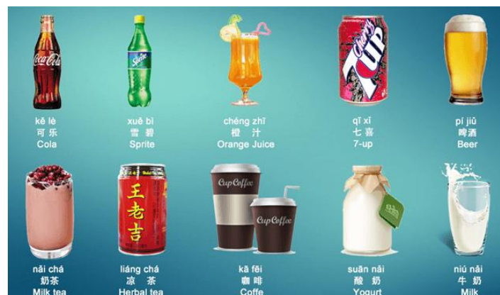
Gambar 12 : Nama minuman dalam bahasa Mandarin