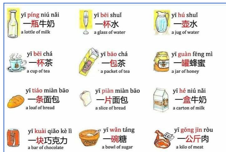
Gambar 7 : kosakata untuk menu sarapan