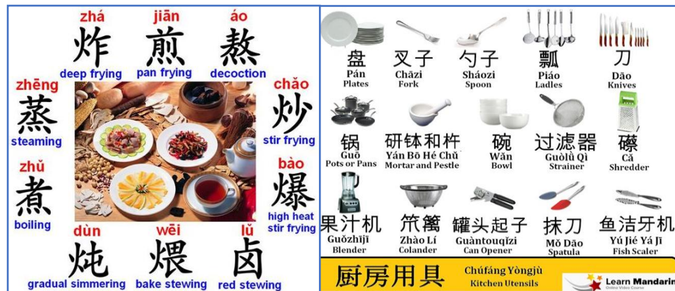
Gambar 10 : Cara memasak dan peralatan dapur