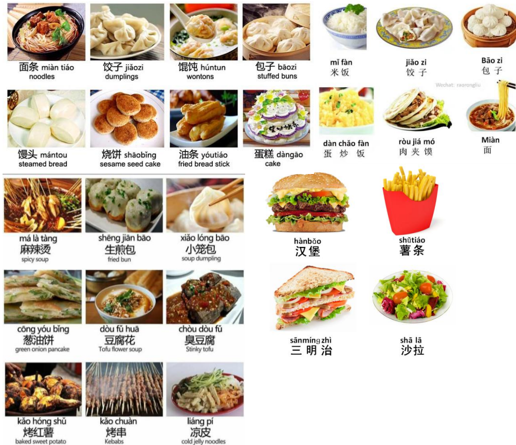
Gambar 8 : Kosakata Chinese food dan makanan lainnya