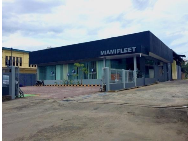
Gambar 4: Tampak depan Sekolah perhotelan Kapal Pesiar Miami Fleet Yogyakarta