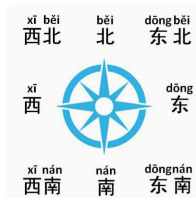
Gambar 11 : Arah dalam bahasa Mandarin