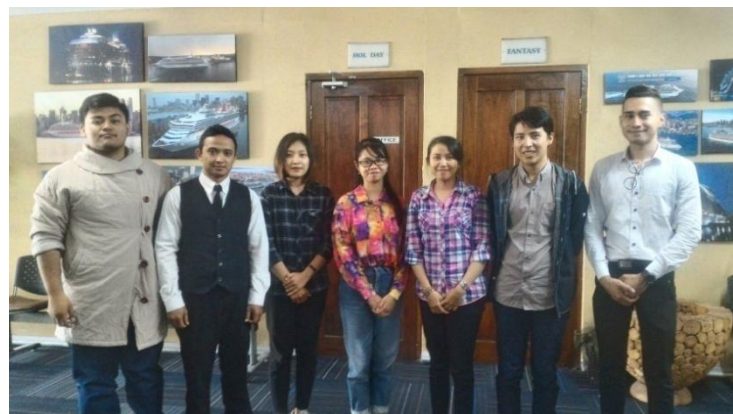
Gambar 4 : Foto bersama siswa-siswi Sekolah Perhotelan Kapal Pesiar Miami Fleet Yogyakarta