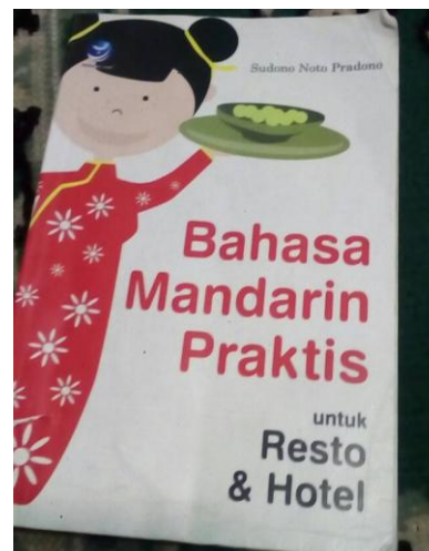
Buku : Bahasa Mandarin Praktis untuk Resto dan Hotel karya Sudono Noto P. (2011)