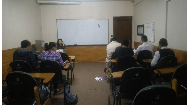
Gambar 1 : Suasana belajar mengajar di Sekolah Perhotelan Kapal Pesiar Miami Fleet Yogyakarta