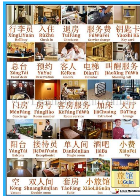
Gambar 6 : Kosakata bahasa Mandarin untuk perhotelan

Lampiran 7. Gambar kosakata yang berhubungan dengan perhotelan dan dapur restoran di kapal pesiar