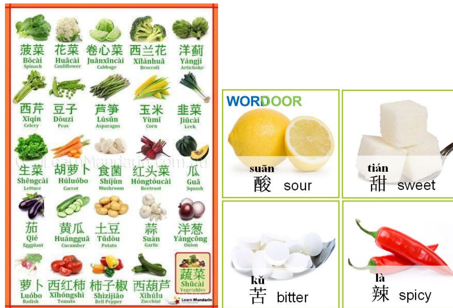
Gambar 13 : Nama sayuran dan rasa dalam bahasa Mandarin