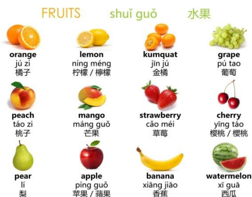
Gambar 9 : Kosakata nama buah