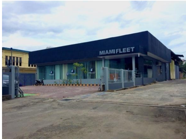
Gambar 4: Tampak depan Sekolah perhotelan Kapal Pesiar Miami Fleet Yogyakarta