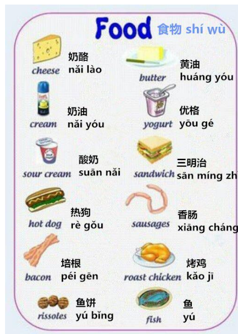
Gambar 14 : Bahan pelengkap makanan