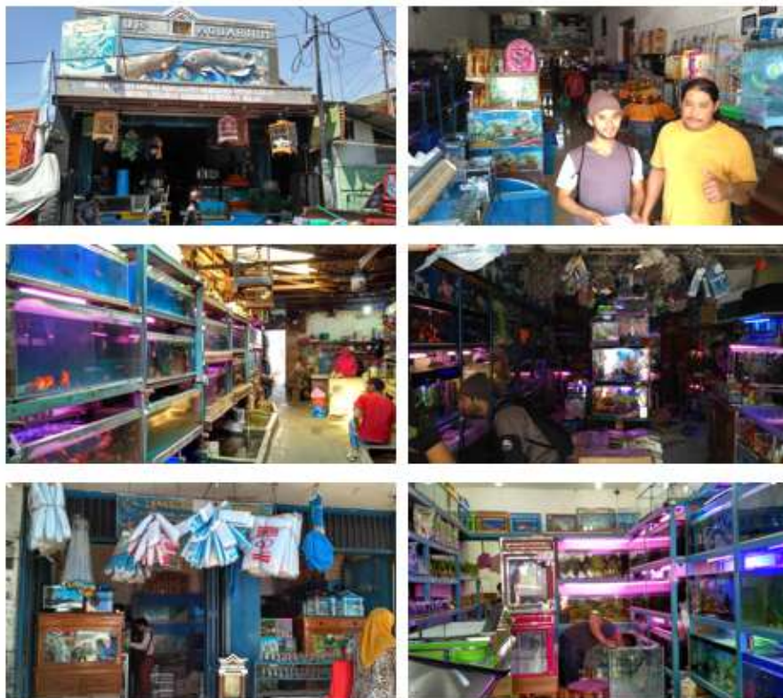
Beberapa toko ikan arwana di Pasar Kanoman

Keterangan: 1. Super red 3. Banjar red 5. Silver 2. Golden red 4. Irian/ Jardini 6. Pino