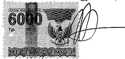
Burhan Agus Purnomo