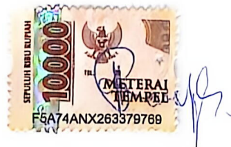
Cut Regia Hedayana