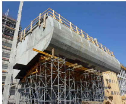
Gambar 1. 1 Beton Struktur

Beton merupakan salah satu material utama dalam bidang konstruksi yang banyak dimanfaatkan karena memiliki kekuatan tekan yang tinggi, ketahanan yang baik terhadap beban, serta kemudahan dalam pembentukannya sesuai dengan desain yang diinginkan. Namun, tingginya produksi beton berdampak pada meningkatnya penggunaan sumber daya alam, terutama agregat dan semen. Oleh karena itu, dibutuhkan terobosan baru dalam pembuatan beton yang tidak hanya memperbaiki kualitasnya, tetapi juga lebih berorientasi pada kelestarian lingkungan.