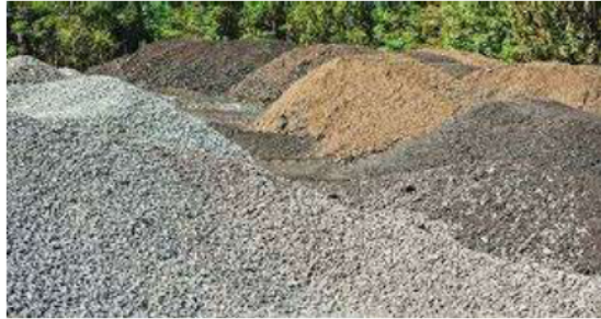
Gambar 2. 2 Agregat Kasar dan Halus

beton, biasanya terdiri dari pasir sebagai agregat halus dan kerikil atau batu pecah sebagai agregat kasar. Fungsi agregat dalam beton meliputi pengurangan penyusutan, peningkatan kekuatan tekan, serta peningkatan ketahanan beton terhadap berbagai kondisi lingkungan.