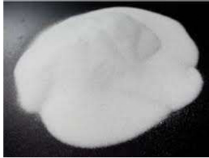
Gambar 1. 2 Serbuk Kaca

Sejumlah studi sebelumnya menunjukkan bahwa serbuk kaca dapat berfungsi sebagai material pengisi (filler) sekaligus sebagai pozzolan, yang membantu meningkatkan struktur beton melalui proses reaksi pozzolanik. Namun, kajian lebih mendalam masih dibutuhkan untuk memahami dampak dari variasi proporsi serta teknik pencampuran serbuk kaca dalam beton guna memperoleh campuran yang paling efektif.