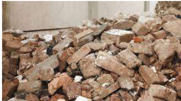
Gambar 2. 7 Agregat Daur Ulang

Material ini diperoleh dari sisa hasil proses pembuatan baja dan dimanfaatkan sebagai bahan pengganti agregat kasar dalam pembuatan beton.