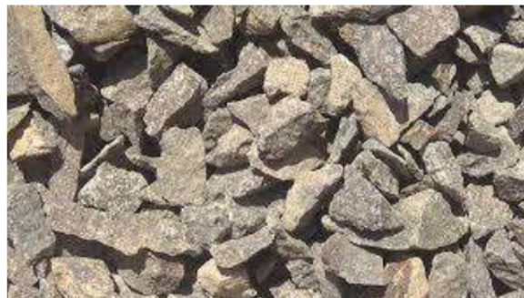
Gambar 2. 5 Batuan Pecah

Batu pecah merupakan material hasil pemecahan batuan hingga berukuran tertentu. Memiliki sudut tajam dan tekstur permukaan yang kasar, batu ini mampu menciptakan ikatan antar partikel (interlocking) yang lebih baik dalam campuran beton, sehingga berkontribusi terhadap peningkatan kekuatan tekan beton secara keseluruhan.