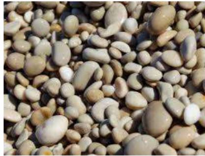
Gambar 2. 4 Kerikil Laut

Mirip dengan kerikil sungai, material ini ditemukan di area pantai atau laut, dan penting untuk memperhatikan kadar garam yang dapat memengaruhi kualitas beton.