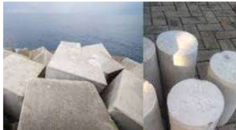
Gambar 2. 1 Beton Silinder

Beton adalah campuran antara semen Portland, agregat seperti pasir, kerikil, dan bahan tambahan lain sesuai kebutuhan. Tujuan perencanaan campuran beton (mix design) yaitu menghasilkan beton yang berkualitas tinggi, nilai kuat tekan optimal, kemudahan pengerjaan, daya tahan lama, efisiensi biaya, serta ketahanan terhadap keausan. Setelah proses pencampuran, beton akan mengeras seperti batu melalui reaksi kimia antara semen dan air. (Hadi, 2022).