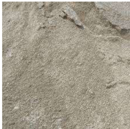
Gambar 2. 8 Agregat Halus

Pasir atau agregat halus merupakan bahan pengisi yang berasal dari proses pelapukan alami batuan, dengan butiran yang tertahan pada saringan No. 200 (0,075 mm) sesuai ketentuan dalam SNI 1970:2008.