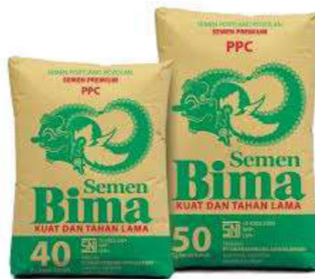
Gambar 2. 9 Semen Portland

Semen portland merupakan jenis semen hidrolik yang dibuat melalui proses penggilingan terak semen portland yang kaya akan kalsium silikat dengan sifat hidrolik, serta ditambahkan senyawa kalsium sulfat, sebagaimana diatur dalam SNI 7656:2012. Jenis semen ini lazim digunakan untuk pembuatan beton, mortar, dan plesteran.