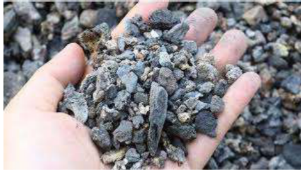
Gambar 2. 6 Terak Timur Tinggi