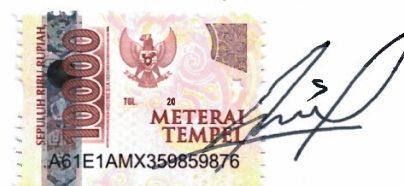
Suci Nur Aini