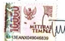
CHIQUITHA TIARA FITHIADI SEDJATI