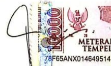
Ardhani Indra Puspita 20/471868/PKU/19229