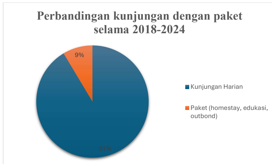
Gambar I.2 Perbandingan Kunjungan Harian dengan Paket

berwisata di Nglanggeran mengambil paket wisata, yang mana paket wisata itu salah satunya terdiri dari paket live in sekaligus homestay (lihat gambar I.2). Sehingga wisatawan yang menginap di Nglanggeran masih cukup sedikit dibandingkan dengan dengan kunjungan singkat