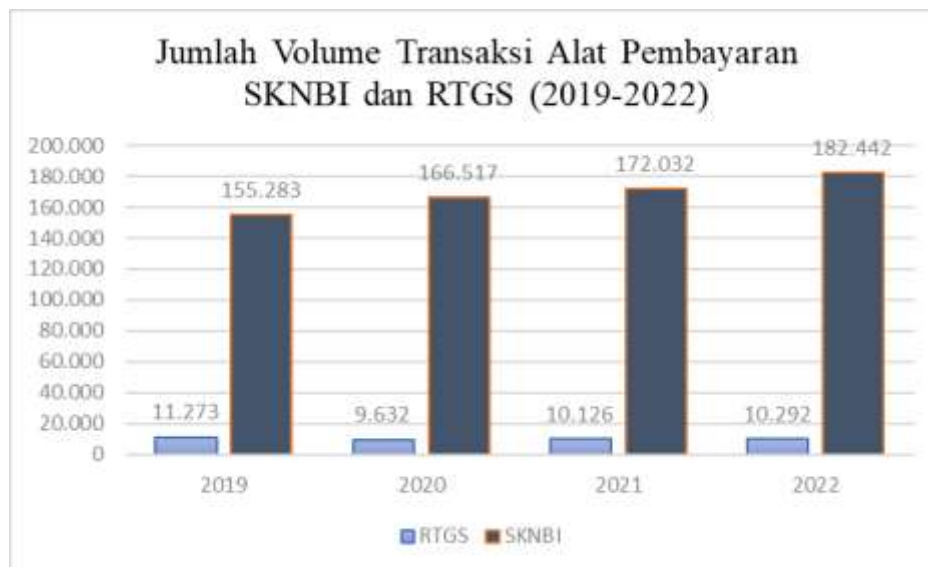
Gambar 1. 3 Jumlah Volume Transaksi SKNBI dan RTGS Tahun 2019-2022

Tren sistem pembayaran APMK yang paling mencolok adalah lonjakan penggunaan uang elektronik pada tahun 2020. Angka ini meningkat lebih dari dua kali lipat dari 7,05 miliar transaksi (2019) menjadi 15,04 miliar transaksi. Lompatan ini sangat dipengaruhi oleh percepatan adopsi dompet digital dan pembayaran berbasis QRIS selama masa pandemi COVID-19. Meski mengalami sedikit penurunan pada 2021, volume transaksi uang elektronik kembali meningkat pada 2022 hingga mencapai 12,33 miliar transaksi. Data ini menegaskan bahwa uang elektronik telah menjadi preferensi utama dalam transaksi harian, terutama untuk pembelian kecil dan kebutuhan transportasi, serta menjadi pendorong utama perubahan perilaku masyarakat menuju sistem pembayaran yang lebih modern dan efisien.