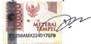
Puan Putri Permata

Saksi 1, sebagai pembimbing tesis/ karya tulis mandiri merangkap anggota tim penguji tesis /karya tulis mandiri: