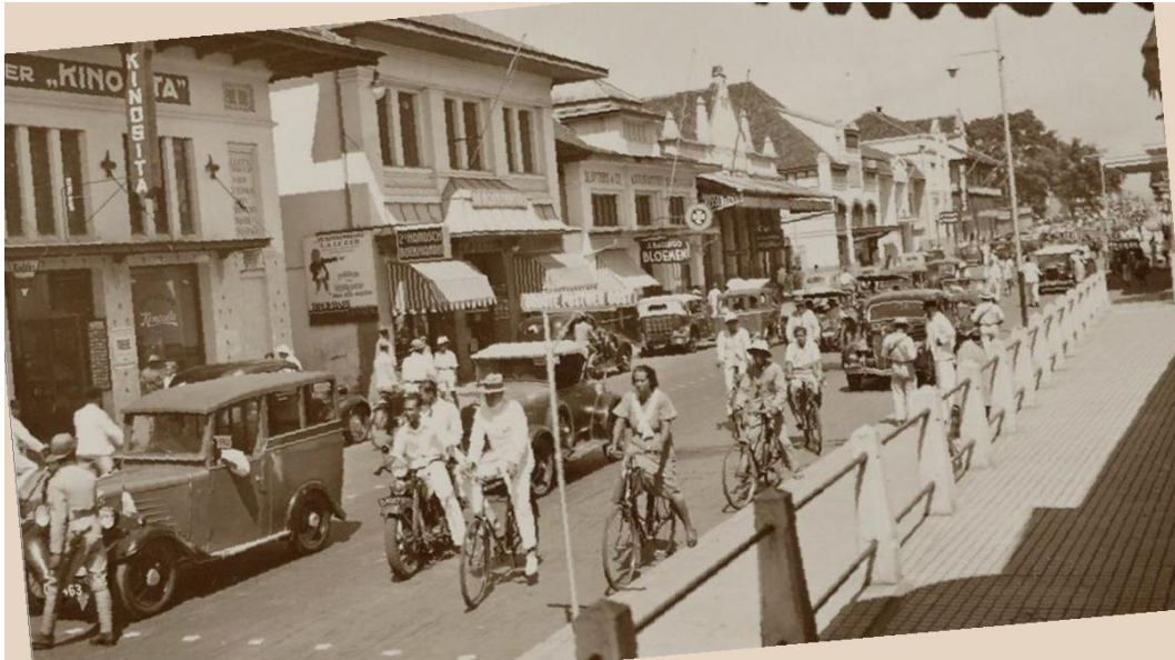
Figur 1. Foto Kota Bandung, 1938.