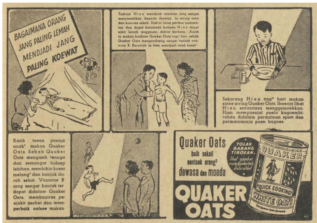
Figur 2. Konsumsi dalam Majalah. Star Magazine, Maret 1941, p. 51