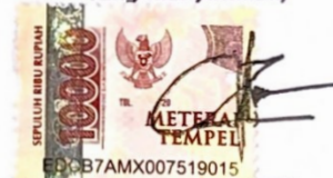
Zabieb Nu'aim Ridwan