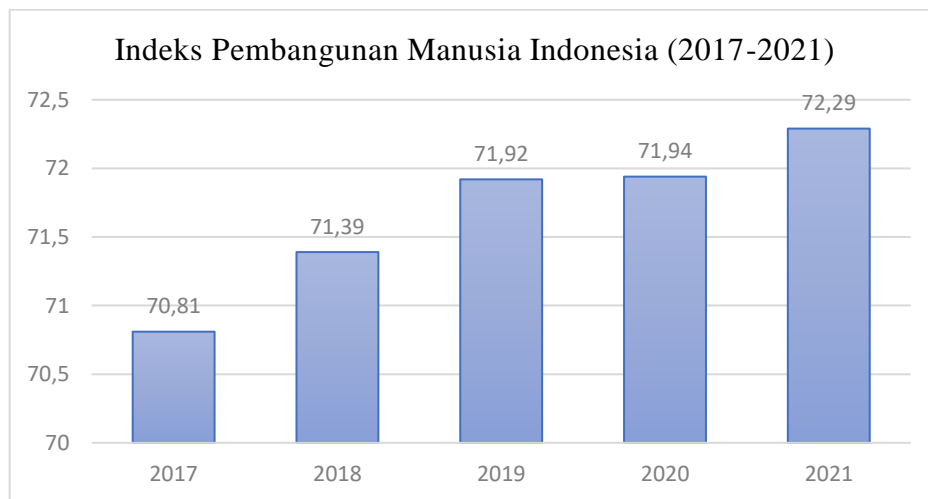
Gambar 1. 2 Indeks Pembangunan Manusia Indonesia (Badan Pusat Statistik)

masih terdapat 22 kabupaten/kota dengan status IPM rendah yang mayoritas berada di wilayah bagian timur (BPS, 2021). Undang-Undang No. 23 Tahun 2014 tentang pemerintahan daerah mengamatkan kewenangan penyelenggaraan pendidikan, kesehatan serta perencanaan dan pengendalian pembangunan oleh pemerintah daerah di wilayahnya, Penelitian Tjodi et al., (2019) dan Muhtarulloh (2021) menemukan bahwa belanja pemerintah di bidang pendidikan, dan belanja modal memberikan pengaruh yang signifikan terhadap peningkatan IPM. Belum meratanya IPM di seluruh wilayah di Indonesia mencerminkan belum berhasilnya penyelenggaraan pelayanan publik oleh pemerintah daerah secara menyeluruh dan perlunya evaluasi kembali atas kinerja pemerintah daerah (Hasibuan, 2020).