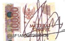
YUSUF WAHYU WIBOWO