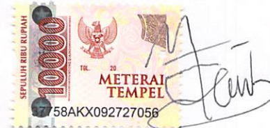
Muhammad Fajar Pribadi 20/454857/EK/22821