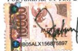
Fahrino Ahmad 22/502097/PEK/28853