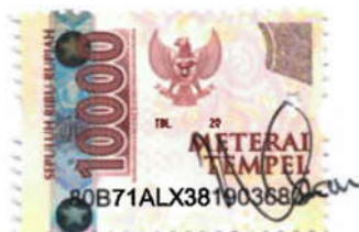
Moh Sahrul Nizam

Yogyakarta, 18 September 2024 Yang Memberi Pernyataan