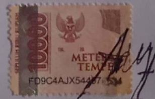
WINDA ISTI WIDYANI