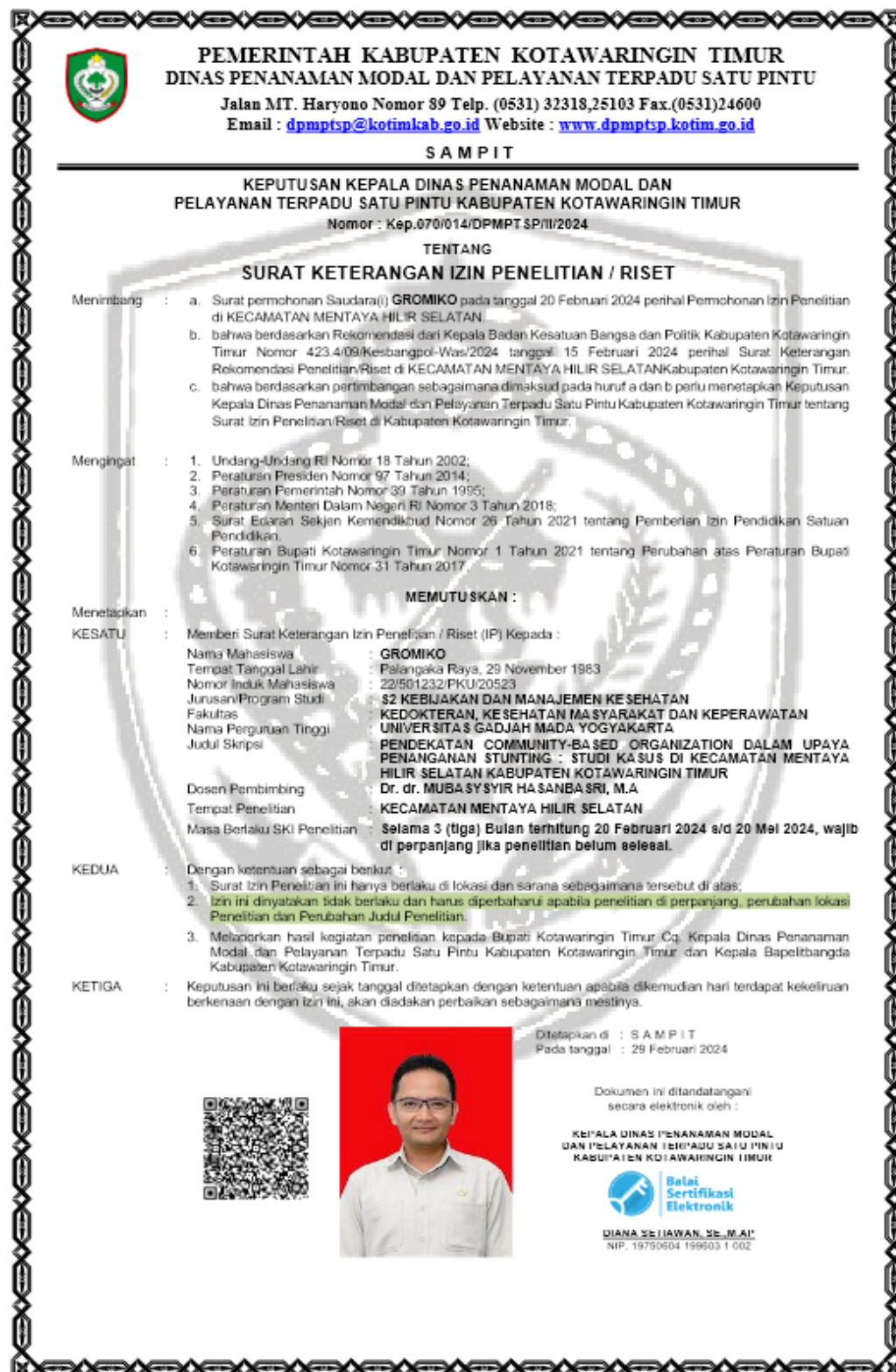
Lampiran 9. Surat Keterangan