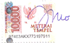
DYENTI DONDO'LOAN PATTOLA

Saksi 1, sebagai pembimbing tesis/ karya tulis mandiri merangkap anggota tim penguji tesis /karya tulis mandiri: