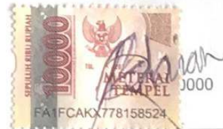
ROVDAIAN BAQRUR ROJI