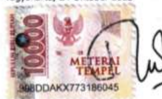
Inggit Kunti Prabawati