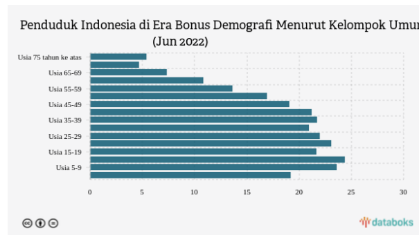
Gambar 1 Grafik Jumlah Penduduk Indonesia Berdasarkan Umur

Indonesia diperkirakan mengalami masa bonus demografi antara tahun 2020 hingga 2030. Bonus Demografi merupakan sebuah kondisi di mana terjadi sebuah peningkatan jumlah penduduk yang berusia produktif dalam suatu negara, yang dapat menjadi dasar untuk pembangunan negara tersebut (Sutikno, 2020). Indonesia saat ini sedang dalam masa bonus demografi berdasarkan hasil Sensus Penduduk. Kondisi ini dianggap sebagai peluang bagi sebuah negara khususnya dalam sektor perekonomian. Bonus demografi yang sedang dialami Indonesia dapat menjadi kesempatan yang berharga untuk meningkatkan perekonomian negara.