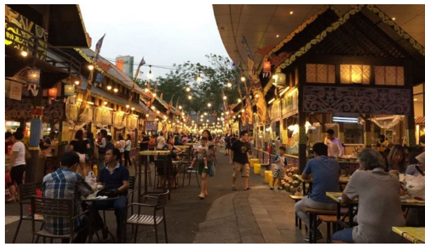
Gambar 3 Kulineran di Tangerang Selatan

Indonesia semakin beragam. Pesatnya perkembangan zaman yang masuk ke Indonesia juga akan berdampak pada gaya hidup dan kehidupan masyarakat saat ini, khususnya pada masyarakat milenial yang cenderung lebih update terhadap perkembangan zaman. Saat ini kegiatan yang bersifat rekreatif menjadi hal yang paling banyak diminati masyarakat. Kegiatan yang bersifat rekreatif dapat memberikan daya tarik tersendiri bagi sebuah tempat untuk dikunjungi. Terlebih bagi masyarakat milenial yang saat ini gemar dengan kegiatan nongkrong , jalan-jalan, hingga kulineran.