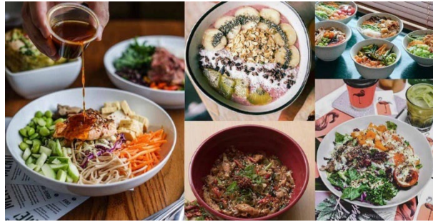
Gambar 4 Makanan Sehat

pangannya sehari-hari. Kuliner bukan hanya sekedar sebagai wadah untuk menyediakan makanan, tetapi dapat dijadikan sebagai hal rekreatif bagi masyarakat. Tentunya mereka yang ingin hidup sehat akan terbantu dengan adanya sarana pusat kuliner yang menyediakan makanan-makanan sehat.