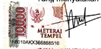
COK ANINDYA PEMAYUN